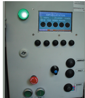
Abfüllsteu. mit Positionierg